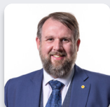
Cadeirydd y Pwyllgor: Peredur Owen Griffiths AS Plaid Cymru