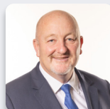
Peter Fox AS Ceidwadwyr Cymreig