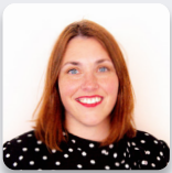
Heledd Fychan AS Plaid Cymru