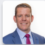
Rhun ap Iorwerth AS Plaid Cymru