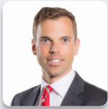
Ken Skates AS Llafur Cymru