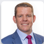
Rhun ap Iorwerth AS Plaid Cymru

Mynychodd yr Aelodau a ganlyn fel dirprwyon yn ystod yr ymchwiliad hwn: