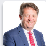
Alun Davies AS Llafur Cymru

Roedd yr Aelodau a ganlyn hefyd yn aelodau o'r Pwyllgor yn ystod yr ymchwiliad hwn: