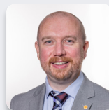
Mabon ap Gwynfor AS Plaid Cymru