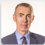
Adam Price AS Plaid Cymru

Mynychodd yr Aelodau a ganlyn fel dirprwyon yn ystod yr ymchwiliad hwn: