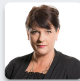
Rhianon Passmore AS Llafur Cymru