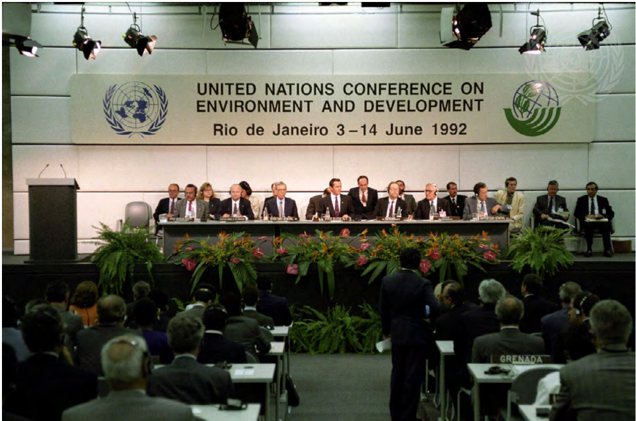
Ffigur 3: Cynrychiolwyr yn Uwchgynhadledd y Ddaear, 1992, lle y cafodd y CAF ei fabwysiadu

Mabwysiadwyd Strategic Plan for Biodiversity 2011 – 2020 yn 10fed Gynhadledd y Partion (COP10) i'r CAF yn Nagoya, Japan, yn 2010. Daeth i'r casgliad a ganlyn: