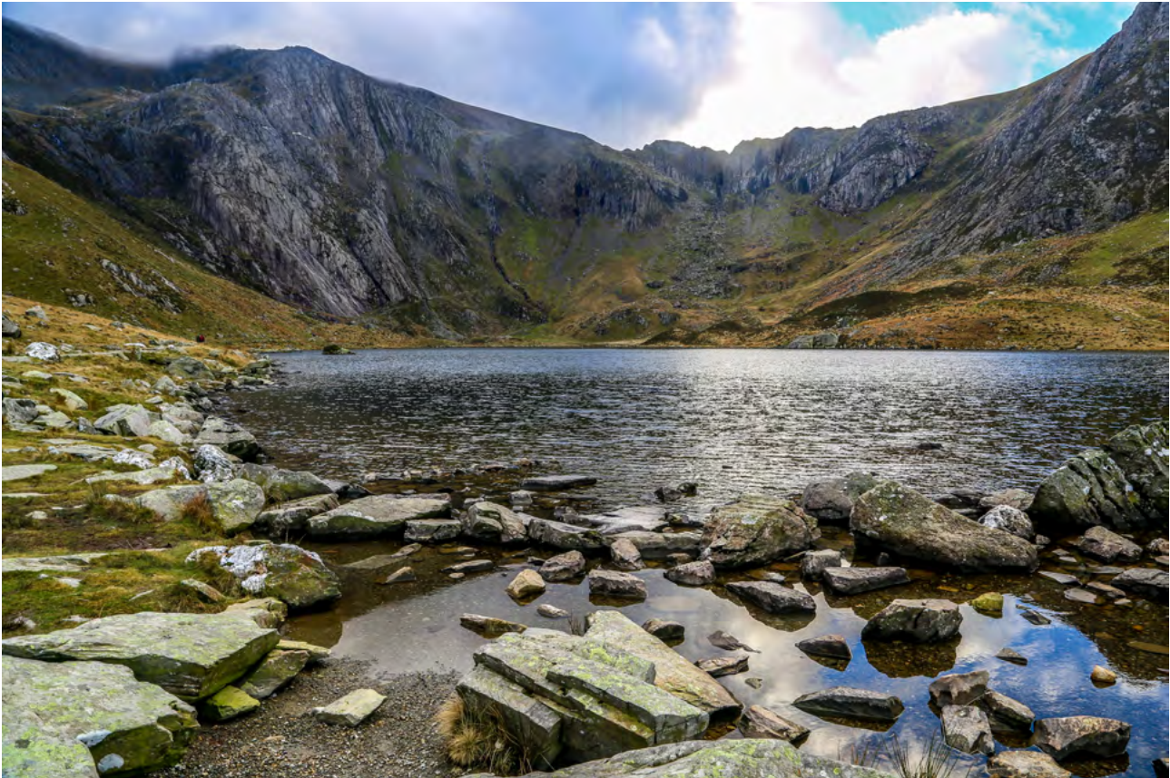
Ffigur 4: Llyn Idwal yn Eryri, un o safleoedd Ramsar Cymru.

Gyda threigl amser, mae nifer fawr o ddynodiadau ar gyfer ardaloedd gwarchodedig wedi datblygu. Mae'r adran hon yn cyfuno mathau o ddynodiadau yng Nghymru a'r ddeddfwriaeth sylfaenol.