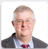
Mark Drakeford AS * Llafur Cymru