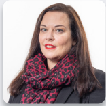
Cadeirydd y Pwyllgor: Vikki Howells AS Llafur Cymru