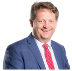
Alun Davies AS LLafur Cymru