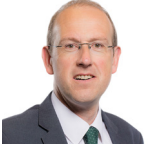
Llyr Gruffydd AS Plaid Cymru