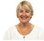
Siân Gwenllïan AS Plaid Cymru