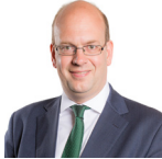
Mark Reckless AS Plaid Brexit