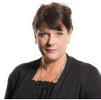
Rhianon Passmore AS Llafur Cymru